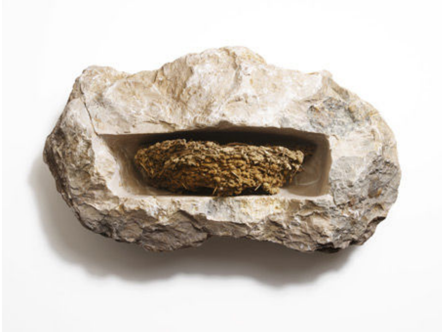
riparo dalla tempesta 1 e 2 – Giacomo Tringali (sculture)