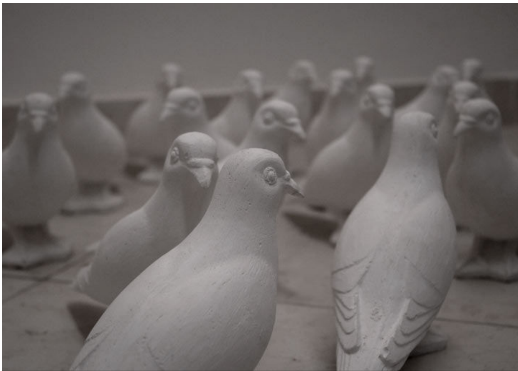
Una colomba ai di – Yo Akao (scultura)