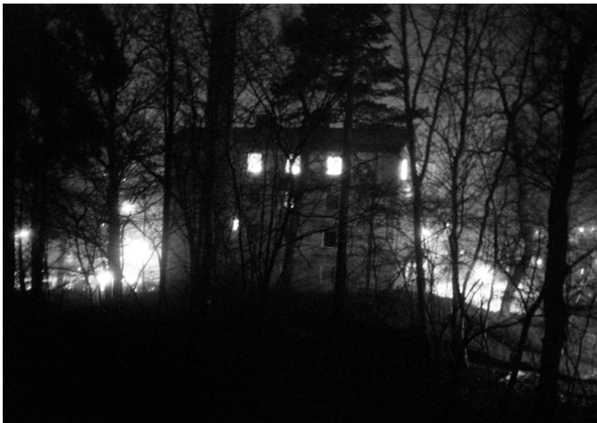
Intimo Nord – Joakim Kocjancic (installazione fotografica – part.)