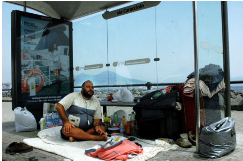
Casa Vacanze – Lorenzo Pari (fotografia)