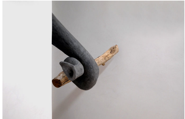
La Memoria di Casa Africa – Rondini/Tourè/Pallini (installazione – part.)

Insieme al progetto Amparo nelle date di Roma e Palermo verrà ospitato il progetto dRakar prodotto dall'Asociación Miop di Barcellona (Spagna). Si tratta di sette progetti personali realizzati sul tema dell'emigrazione, del rifugio e della memoria, da giovani artisti provenienti da tutta la Spagna durante la fase di ricerca sociale del progetto a Dakar, in Senegal. Il progetto verrà in seguito esposto in spazi espositivi pubblici e privati in Senegal, al Centro Blaise Senghor di Dakar ed a Duta Seck, ed in Spagna, a Barcellona, Zaragoza, Tenerife etc.