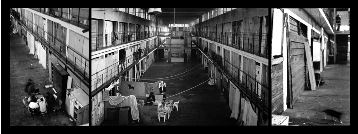
Esilio Politico – Lorenzo Pari (fotografia)