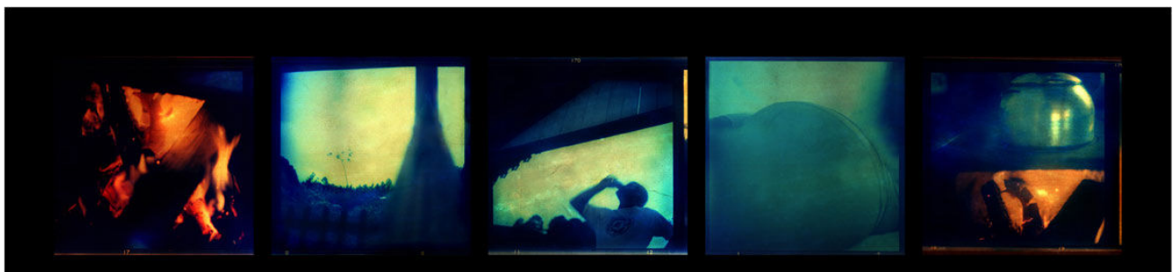
Caxixe (para W. Klein)