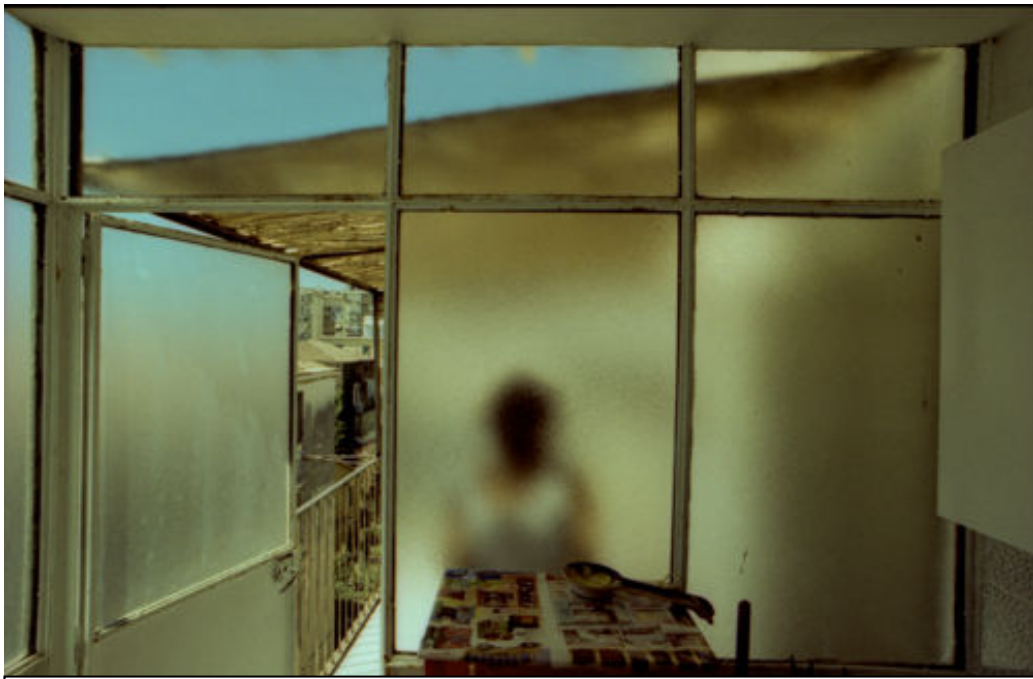
Interno 17