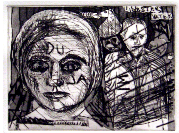
Casa Kafka – Lorenzo Bruschini (incisione calcografica)