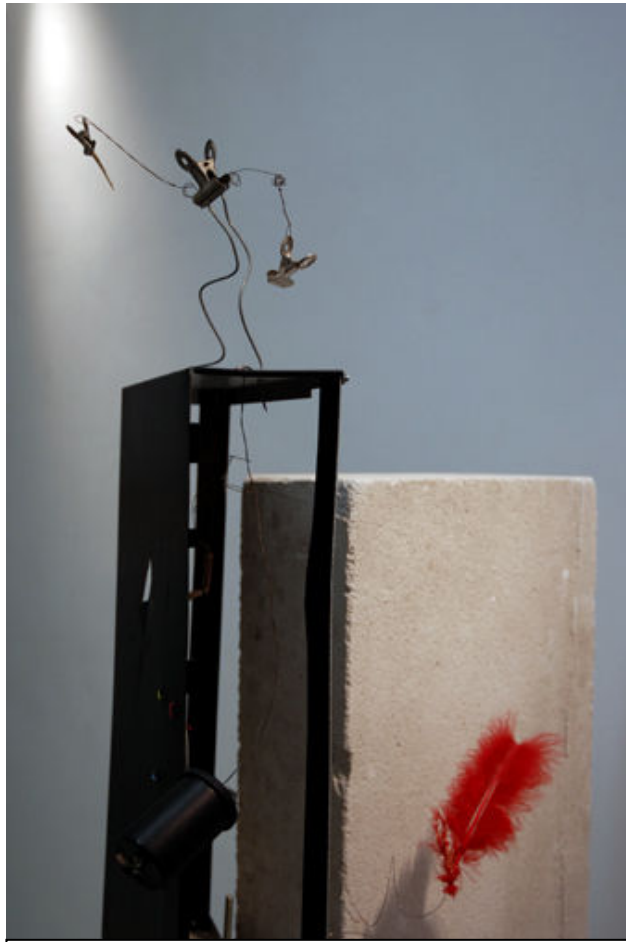
Killer Robot 248 scala B int 16 – Franco Di Majo (scultura interattiva)